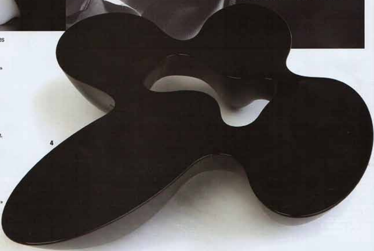
(1) Installations de pièces en verre, en bois de noyer et marbre durant l'exposition « Rien de 9 » dans le quartier de Ventura Lambrate en avril dernier à Milan. (2) Fauteuil en marbre « Sunshare » produit en édition limitée par l'éditeur Torart à Carrare. (3) Lampe « Ankaa » de la série « Satelight » en Plexiglas réalisée à partir de la technologie du fraisage digital pour l'éditeur italien Metea. (4) Table basse « Quark » en marbre noir de Belgique pour Nilufar.

Les projets présentés, en avril dernier, lors de l'exposition « Rien de 9 » dans le quartier milanais de Ventura Lambrate nous ont permis de juger les pièces exceptionnelles en verre soufflé, marbre et bois précieux de ce designer-plasticien consultant pour Gedy et Baccarat qui vient de transférer son studio milanais aux Pays-Bas. Représentés par les galeries Nilufar, Franziska Kessler, The Apartment, White Moon Gallery et Mitterrand Cramer, ses travaux s'appuient sur l'excellence des savoir-faire liés au patrimoine et soulignent le mariage de la technologie de pointe avec les matériaux les plus nobles. Ainsi ses vases « Osmosi » font fusionner la finesse du verre avec la roche de Carrare. A découvrir ses pièces sensibles pour Covo, Olucce et Venini ainsi que sa collection de tapis réalisées en Inde. www.babled.net . C.S.